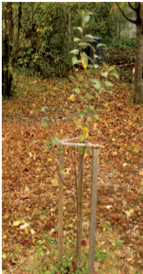
Karcsú derekú pónyik áll Isten irgalmában

A verscsatolmány a Koldus tündérek . Az elhagyott Áprily-kert pónyikalmáiról szól, és a Kolozsváron egy évvel később megjelent Kenyér helyett kötetben jelent meg. Ez a kötet Reményik istenes verseinek első