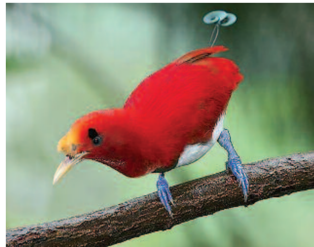
Király paradicsommadár (Cicinnurus regius) www.idre.hu

Magányosan dörög, ilyenkor különböző mozdulatokat végez, és ezek érvényre juttatják teljes szín pompájának igazi fényét. Néha felcsapja kiterjesztett farkát, s ilyenkor a zöldesen csillogó, spirális lapocskák a háta felett remegnek. Faodúban fészkel, annak mélyén a tojó 17 napig kotol. Ez a faj Új-Guinea és a szomszédos szigetek síksági erdőseiben él.