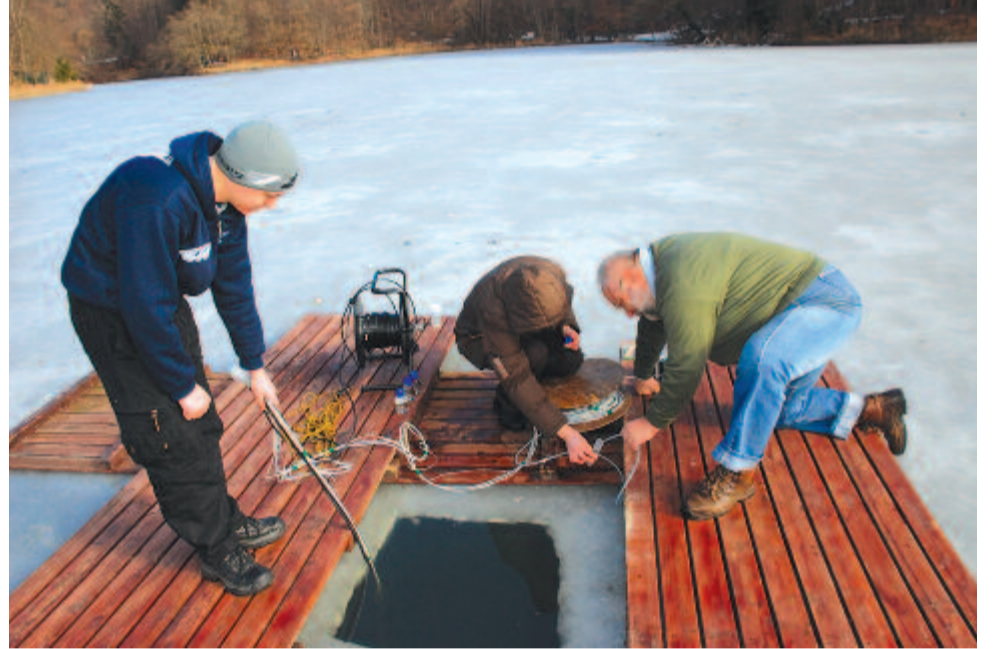
Mintavételezés télen a Medve-tavon

Az elmúlt nyolc évben a Sapiaientia EMTE