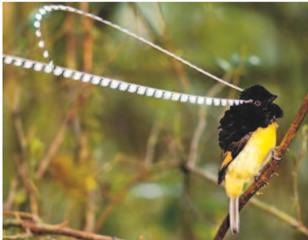
Fátyolos paradicsommadár (Pteridophora alberti) www.csirip.hu

A faj tollai rendkívül változatos alkatúak. A szokott formától a legjobban a fátyolos paradicsommadár tollai külön-