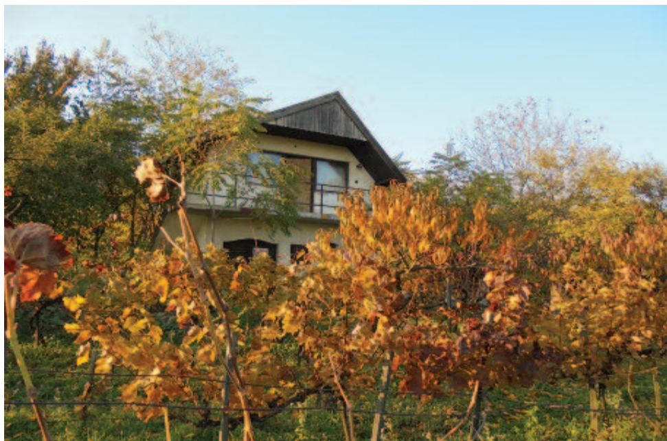
Járom a tessék-sort döngölt utak mentén

November 11. Márton napja. Szent Márton Pannóniában, Sabaria városában, Szombathelyen született, de Paviában nevelkedett. Mikor a császár elrendelte, hogy a veteránok fiai harcoljanak az atyák helyett, hadba rendelték Mártont is, mihelyt tizenöt éves lett. A legenda szerint 334-ben a galliai Ambianum (Amiens) városkapuja előtt találkozott egy fázó koldussal. Köpenyét kettéhasította és egyik felét a koldus vállára terítette. A következő éjszaka álmában megjelent neki